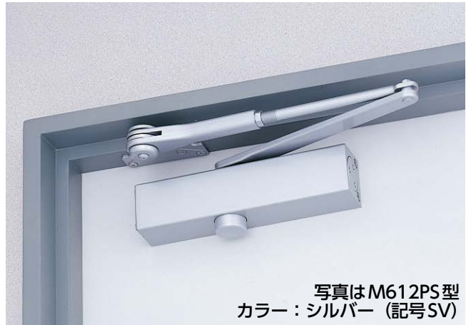
写真はM612PS型 カラー：シルバー（記号SV）