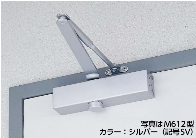
写真はM612型 カラー：シルバー（記号SV）